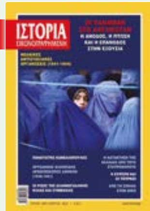
# 645 / ΜΑΡΤΙΟΣ 2022