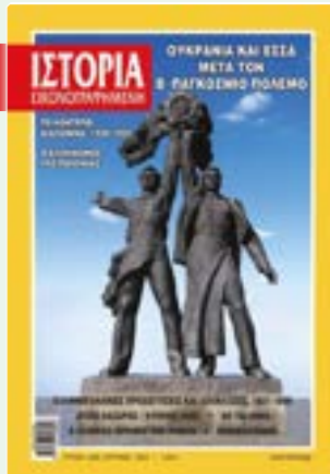
# 646 / ΑΠΡΙΛΙΟΣ 2022