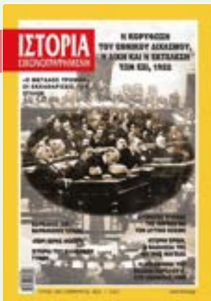
# 644 / ΦΕΒΡΟΥΑΡΙΟΣ 2022