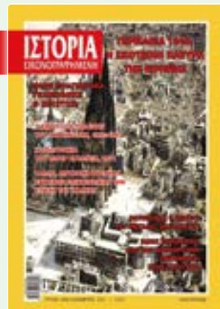
# 642 / ΔΕΚΕΜΒΡΙΟΣ 2021