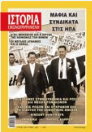
# 647 / ΜΑΪΟΣ 2022