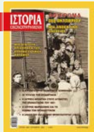
# 640 / ΟΚΤΩΒΡΙΟΣ 2021