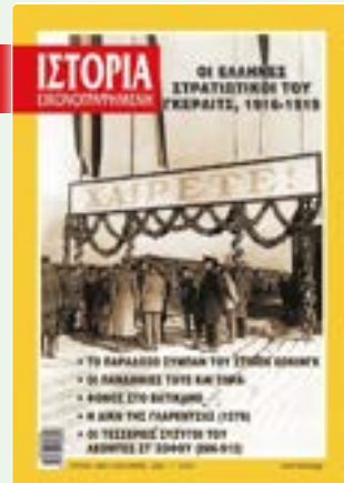
# 643 / ΙΑΝΟΥΑΡΙΟΣ 2022