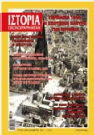
# 642 / ΔΕΚΕΜΒΡΙΟΣ 2021