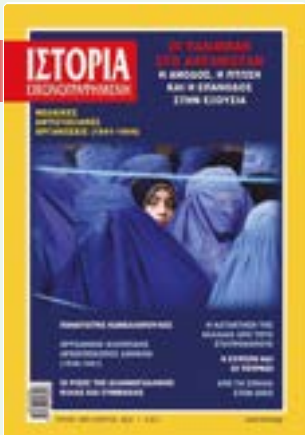
# 645 / ΜΑΡΤΙΟΣ 2022