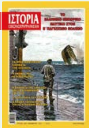
# 641 / ΝΟΕΜΒΡΙΟΣ 2021