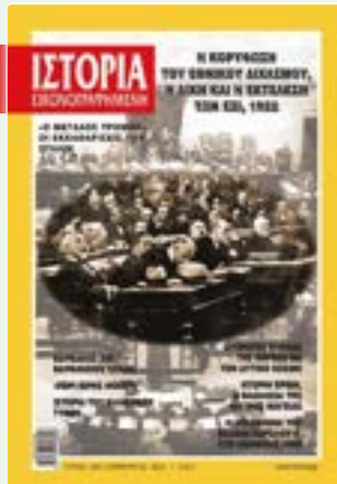
# 644 / ΦΕΒΡΟΥΑΡΙΟΣ 2022