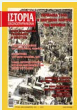
# 642 / ΔΕΚΕΜΒΡΙΟΣ 2021