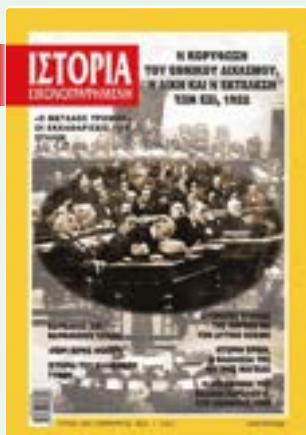
# 644 / ΦΕΒΡΟΥΑΡΙΟΣ 2022