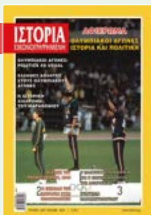
# 637 / ΙΟΥΛΙΟΣ 2021