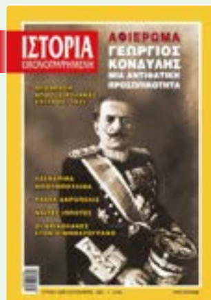
# 639 / ΣΕΠΤΕΜΒΡΙΟΣ 2021