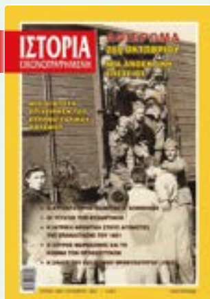
# 640 / ΟΚΤΩΒΡΙΟΣ 2021