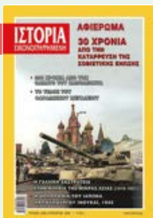
# 638 / ΑΥΓΟΥΣΤΟΣ 2021