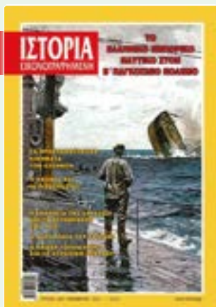
# 641 / ΝΟΕΜΒΡΙΟΣ 2021