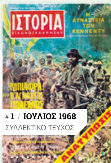
# 1 / ΙΟΥΛΙΟΣ 1968