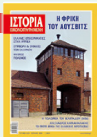
# 625 / ΙΟΥΛΙΟΣ 2020

ΜΟΝΟ ΓΙΑ ΨΗΦΙΑΚΗ ΑΝΑΓΝΩΣΗ ΨΗΦΙΟΠΟΙΗΣΗ: Κ. ΠΑΠΑΔΟΠΟΥΛΟΣ