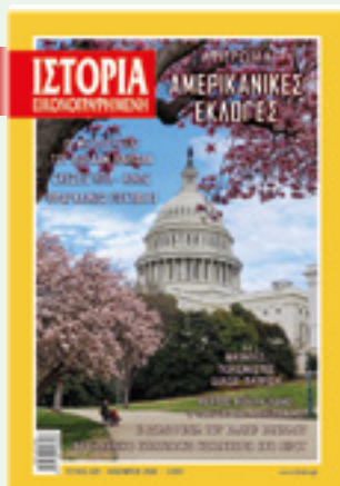
# 629 / ΝΟΕΜΒΡΙΟΣ 2020