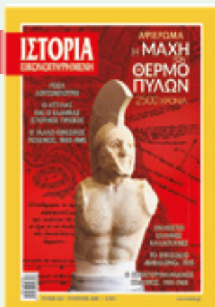
# 626 / ΑΥΓΟΥΣΤΟΣ 2020