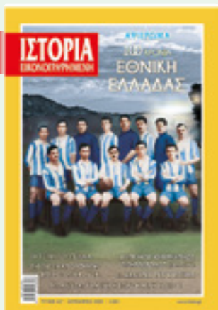
# 627 / ΣΕΠΤΕΜΒΡΙΟΣ 2020