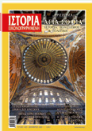
# 630 / ΔΕΚΕΜΒΡΙΟΣ 2020