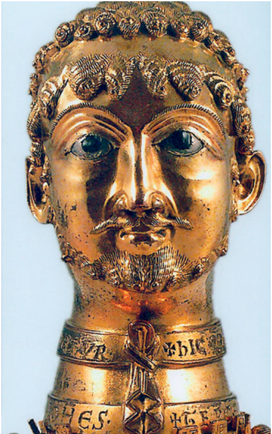
Προτομή από μπρούντζο του Φρειδερίκου Μπαρμπαρόσα (1160).