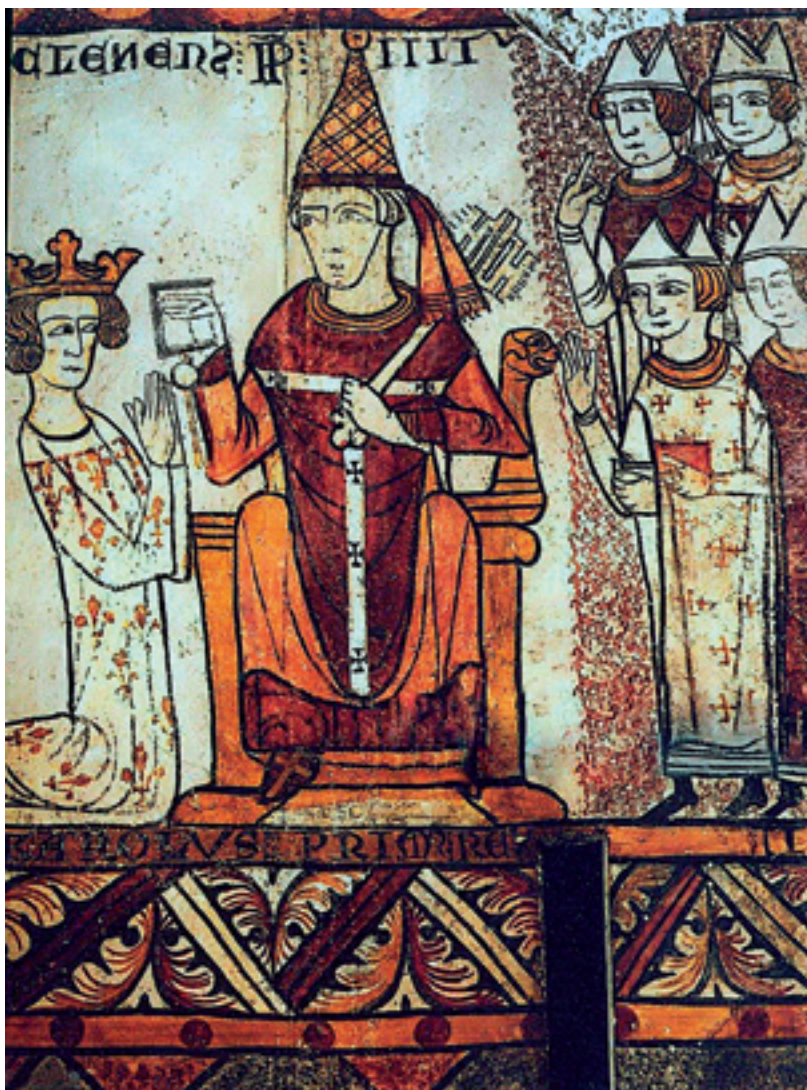
Ο Κάρολος του Ανζού στέφεται βασιλιάς της Σικελίας από τον πάπα Κλήμη Δ', τον Ιανουάριο του 1266 (τοιχογραφία του 13ου αιώνα στον πύργο Φεράντε, Περν λε Φοντέν, Προβάνς-Αλπ-Κοτ ν'Αζύρ).

Καρόλου διέσχισε τα σύνορα και εισήλθε στο Βασίλειο. Αυτή τη φορά η εκστρατεία δεν θα κρατούσε πολύ. Οι δύο στρατοί ήρθαν αντιμέτωποι στις 26 του μηνός, έξω από την παλιά ρωμαϊκή πόλη του Μπενεβέντο, και όλα τελείωσαν πολύ γρήγορα. Ο Μανφρέδος, γενναίος όπως πάντα, δεν υποχώρησε και πέθανε πολεμώντας, οι στρατιώτες του όμως, που δεν είχαν καμία