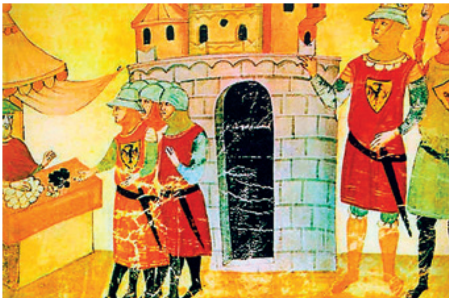
Τα στρατεύματα του Φρειδερίκου Β' πληρώνονται με δερμάτινα νομίσματα κατά τη διάρκεια της πολιορκίας της Μπρέσια και της Φαένζα (Ρώμη, Βιβλιοθήκη Βατικανού). ΑΠΕΝΑΝΤΙ: Η Μάχη του Λενιάνο, το 1176 (έργο του Άμος Καζιόλι, 19ος αι., Φλωρεντία, Παλάτσο Πίτι).

Ωστόσο, ο Φρειδερίκος χειρίστηκε το ζήτημα με τον χειρότερο δυνατό τρόπο. Αρχικά, όταν προσκάλισε τον Ιωάννη του Ιμπελέν μαζί με τον νεαρό βασιλιά και τους τοπικούς άρχοντες και βαρόνους σε ένα μεγαλόπρεπο δείπνο στο κάστρο της Λεμεσού, συμπεριφέρθηκε με περίσσεια ευγένεια. Το δείπνο ξεκίνησε ήρεμα, στη συνέχεια όμως μία ομάδα στρατιωτών με γυμνά ξίφη εισήλθαν ξαφνικά στην αίθουσα και έλαβαν θέσεις περιμετρικά. Επικράτησε σιωπή και τότε ο αυτοκράτορας σηκώθηκε όρθιος και με βροντερή φωνή είπε τον