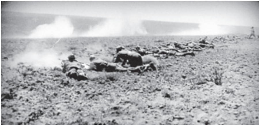
Διμοιρία Πεζικού μαχόμενη στο Μακεδονικό Μέτωπο. ΚΑΤΩ: Έφοδος ελληνικής διμοιρίας κατά των βουλγαρικών θέσεων στη μάχη του Κιλκίς (1913).