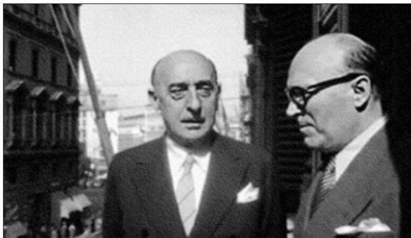
Με τον Αλέξανδρο Παπάγο το 1953 στη Ρώμη. ΑΠΕΝΑΝΤΙ: Ο πρωθυπουργός Παπάγος με τους δύο αντιπροέδρους της κυβέρνησής του, Στ. Στεφανόπουλο και Π. Κανελλόπουλο (1954).

Μέλος της Διοικούσας Επιτροπής του Λαϊκού Κόμματος, διετέλεσε επί σειρά ετών υπουργός παραγωγικών υπουργείων (Συντονισμού, Εθνικής Οικονομίας, ίδρυσε το υπουργείο Μεταφορών), επί δε διακυβέρνησης Ελληνικού Συναγερμού του Παπάγου υπήρξε αντιπρόεδρος της κυβέρνησης και υπουργός Εξωτερικών. Από την υπεύθυνη αυτήν θέση υπήρξε ο πρώτος που χειρίστηκε το Κυπριακό με επιτυχία, δεδομένου ότι επέτυχε να εγγραφεί αυτό για πρώτη φορά ως διεθνές θέμα στην ημερήσια διάταξη του ΟΗΕ. (Εκείνη την εποχή, τη δεκαετία του 1950, κάτι τέτοιο φαινόταν ακατόρθωτο λόγω της λυσσώδους αντίδρασης της κραταιάς τότε μεταπολεμικής νικήτριας, της Μεγάλης Βρετανίας). Ο Στεφανόπουλος χειρίστηκε υπεύθυνα το Κυπριακό κατά την πρώτη του κρίσιμη τριετία. Γενικά η συμβολή του Στεφανόπουλου στη διακυβέρνηση της Ελλάδας ήταν τόσο καθοριστική ώστε ο πρόεδρος της κυβέρνησης, στρατάρχης Παπάγος, την ύστατη στιγμή, πεθαίνοντας, τον όρισε ως διάδοχό του, προτιμώντας τον από τον άλλο αξιολογώτατο επίσης αντιπρόεδρο, τον Παυγιώτη Κανελλόπουλο.