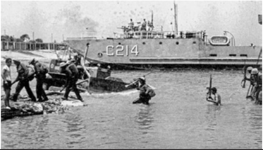
Οι τελευταίοι Τούρκοι στρατιώτες κατά την απόβαση της 20ής Ιουλίου βγαίνουν στη στεριά. ΑΠΕΝΑΝΤΙ: Αιχμάλωτοι των τουρκικών δυνάμεων.

του απαραβίαστου των συνόρων. Άρα, και η δημιουργία μίας ή παραπάνω αποσχιστικών οντοτήτων που έρχονται σε αντίθεση με τις αρχές αυτές δεν μπορούν να τύχουν αναγνώρισης από τη διεθνή κοινότητα.