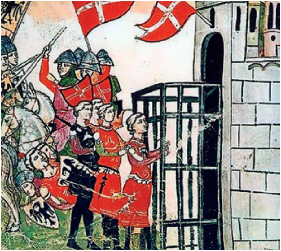
Μικρογραφία του 15ου αιώνα που απεικονίζει τη μάχη της Φοσάλτα, το 1249 (Ρώμη, Βιβλιοθήκη Βατικανού). ΚΑΤΩ: Η στέψη του Κορράδου Δ', σε γαλλικό χειρόγραφο του 14ου αιώνα.