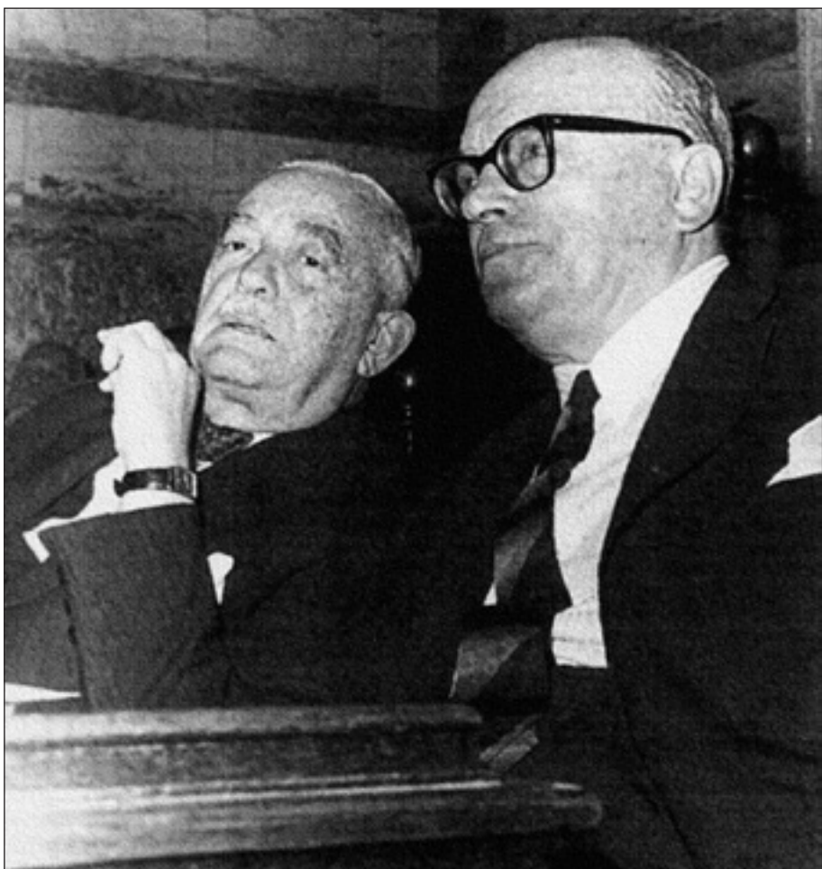
Με τον Γεώργιο Αθανασιάδη-Νόβα, πρώτο πρωθυπουργό της Αποστασίας, μετά την άρση εμπιστοσύνης της ΕΡΕ προς την κυβέρνησή του.

Ξαφνικά ο βασιλέας Κωνσταντίνος ήλθε σε έμμιση συνεννόηση με τον παντοδύναμο Καραμανλή και απέσυρε την υποστήριξή του από την ΕΠ. Αποτέλεσμα, η ΕΠ, με το σύστημα της ενισχυμένης αναλογικής που ευνοούσε το πρώτο κόμμα, έλαβε 6,82% των ψήφων, εξέλεξε πέντε βουλευτές, ενώ ο ίδιος ο Στεφανόπουλος δεν εξε-