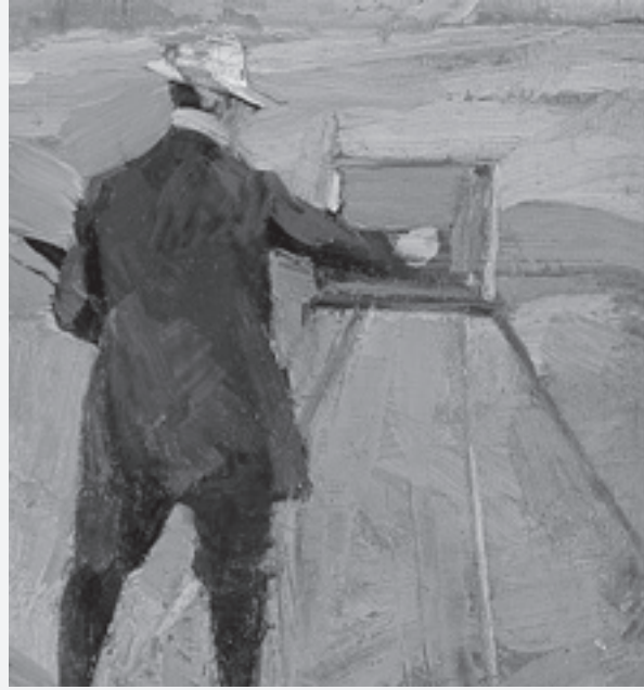
Νικόλαος Λύτρας, Ο ζωγράφος Ουμβέρτος Αργυρός [Σπουδή].

Στους φιλόξενους χώρους του Βυζαντινού Μουσείου η Εθνική Πινακοθήκη διοργανώνει την έκθεση «Ομάδα ΤΕΧΝΗ, 100 χρόνια, οι πρώτοι Έλληνες μοντερνιστές» και ο Ελευθέριος Βενιζέλος.