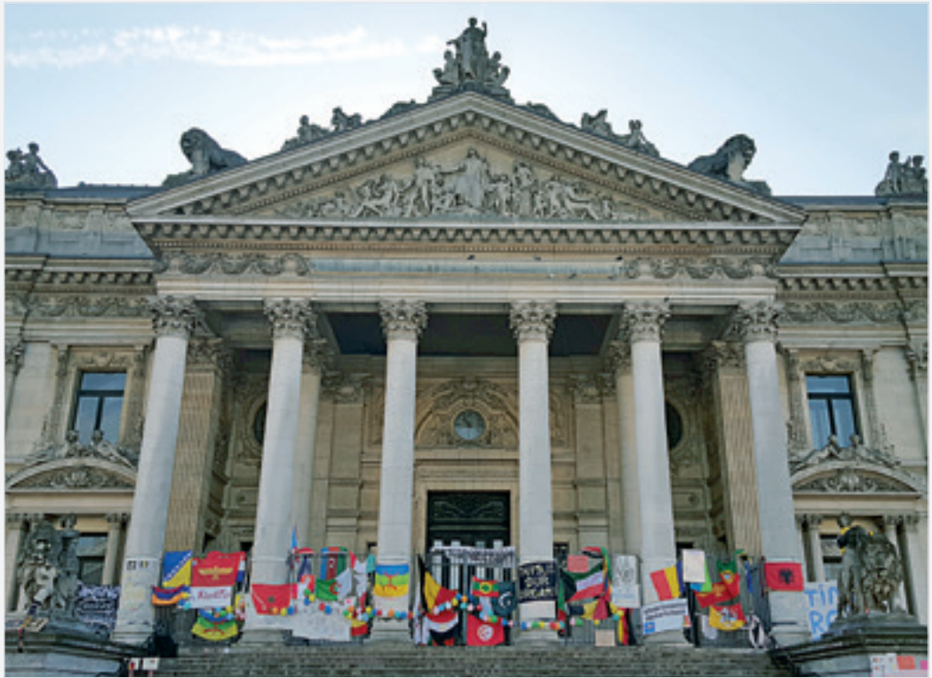
Οι Βρυξέλλες μετά το τρομοκρατικό χτύπημα, τον Μάρτιο του 2016.