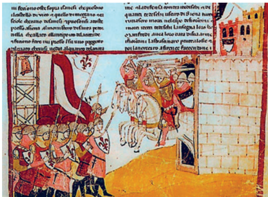
Ο Φρειδερίκος Β' κατατροπώνει τους Γουέλφους στην Κορτενούοβα (1237). Μικρογραφία από το χειρόγραφο του Τζιοβάνι Βιλάνι (14ος αι., Ρώμη, Βιβλιοθήκη Βατικανού). ΑΠΕΝΑΝΤΙ: Απεικόνιση του πάπα Ιννοκέντιου Δ' σε χειρόγραφο του 12ου αιώνα (Βρετανική Βιβλιοθήκη).

ακόμη συμβούλιο για το επόμενο καλοκαίρι στην Ακουιλία, καθιστώντας σαφές ότι αν ο γιος του αφηφούσε το κάλεσμά του θα είχε εκείνος την ευθύνη. Αυτή τη φορά ο Ερρίκος δεν τόλμησε να παρακούσει και αναγκάστηκε να δώσει όρκο ότι στο εξής θα υπερασπιζόταν τα δικαιώματα και τις θέσεις του αυτοκράτορα, απολύοντας τους συμβούλους που τον είχαν ενθαρρύνει να εφαρμόσει τις καταστροφικές του τακτικές. Ωστόσο, ο Φρειδερίκος έκανε μεγάλο λάθος που πίστεψε ότι με έναν υπάκουο γιο και με θετικά διακείμενους πρίγκιπες θα καθυπότασσε τη Λομβαρδία. Τα περισσότερα από τα 19 τελευταία χρόνια της ζωής του είχε βρεθεί σε πολεμικές συγκρούσεις βόρεια και νότια της Ιταλικής Χερσονήσου, αγωνιζόμενος, όπως παλαιότερα είχε αγωνιστεί και ο παππούς του, να εδραιώσει την εξουσία του. Υπήρχε, ωστόσο, μια σημαντική διαφορά ανάμεσά τους. Ο Φρειδερίκος Βαρβαρόσας ήταν πέραν κάθε αμφιβολίας Γερμανός και η αυτοκρατορία του ήταν μια