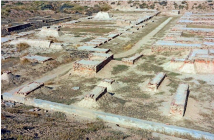
Άποψη των ανασκαφών της Σιταποθήκης και της Μεγάλης Αίθουσας στο Ανάχωμα F της Χαράπα. ΑΠΕΝΑΝΤΙ: Σφραγιδόλιθοι από την Κοιλιάδα του Ινδού (Λονδίνο, Βρετανικό Μουσείο).

Μέσα σε λίγους μόλις μήνες άρθρα, τα οποία δημοσιεύθηκαν σε εθνικής εμβέλειας ειδησεογραφικά περιοδικά της Ινδίας, γραμμένα από ερευνητές όπως ο Μάικλ Βίτσελ, καθηγητής της Σανσκριτικής στο Πανεπιστήμιο του Χάρβαρντ, σε συνεργασία με τον Στιβ Φάρμερ, απέδειξαν ότι Η Αποκρυπτογραφημένη Γραφή του Ινδού ήταν μια ανοησία. Στο άρθρο τους «Παράλογα παιχνίδια στη Χαράπα», οι Βίτσελ και Φάρμερ απέδειξαν πέραν πάσης αμφιβολίας, ακόμη και για τους μη ειδικούς, ότι το υποτιθέμενο αλφάβητο του Ινδού ήταν τόσο απίθανα ευέλικτο, ώστε κάποιος μπορούσε να το χρησιμοποιήσει για να προσκομίσει σχεδόν κάθε μετάφραση που θα